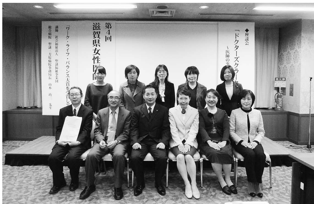
2015年12月5日(土) 第4回女性医師交流会

今年度は、古くて新しい「当直・待機」問題を取り上げて、滋賀県内の全病院にアンケート調査を実施しています。「当直」については、2002年に厚生労働省が通知（基発第0319007号）で適正化に向けた指導を行っていますが、それから14年経過して、現状は改善？不変？悪化？どうなっているのでしょうか。「当直・待機」業務を改善することは、女性だけでなく男性にとっても働きやすい職場、継続できる職場を提供することになると思われます。この問題をめぐる講演会と報告・シンポジウムを2017年2月18日（土曜日）午後で開催します（詳細は裏面参照）。多くの方々のご参加を心から願っております。